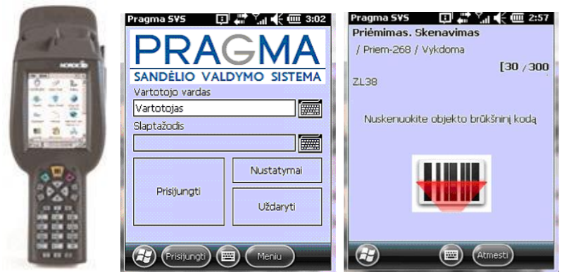
2 pav. Fakto fiksavimas delniniukais